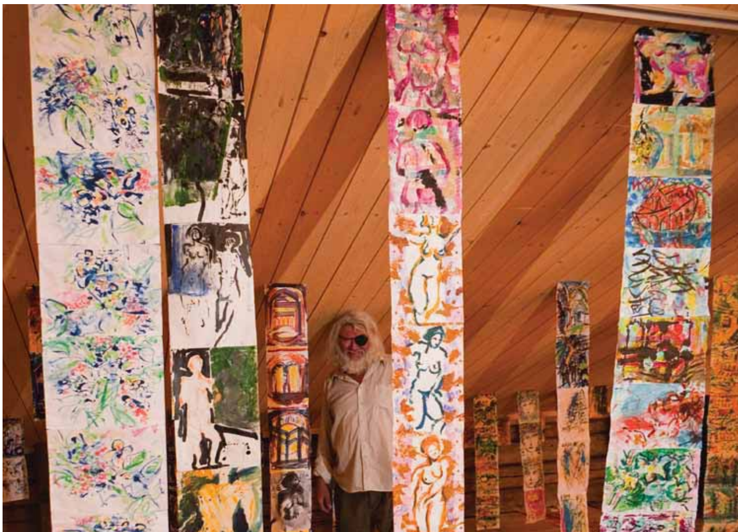
Näyttelytyöt ripustettiin ilmavasti, siten että hienot ja arvokkaat rakennuksen rakenteet jäivät myös näkyviin.