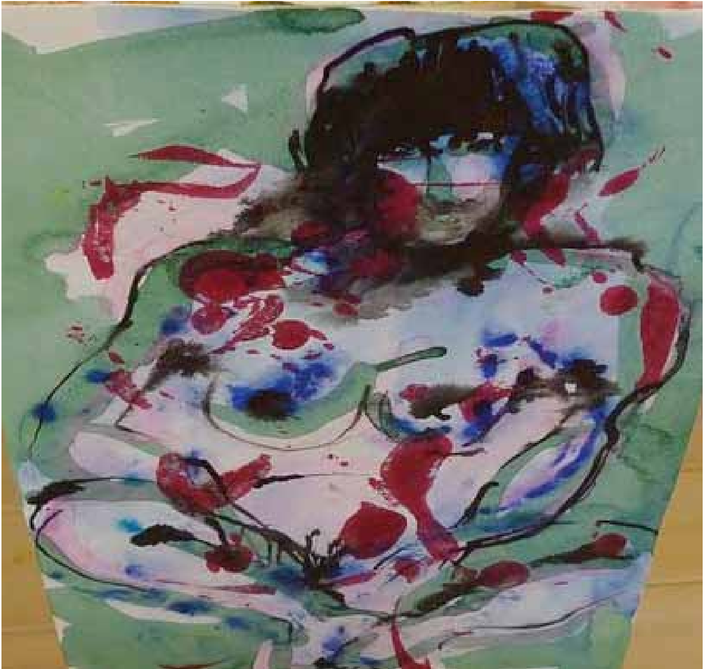
Hieno yksityiskohta joka on poimittu Eeron näyttelystä. – Näitä lähikuvia olisi pitänyt ottaa enemmän - j.v.