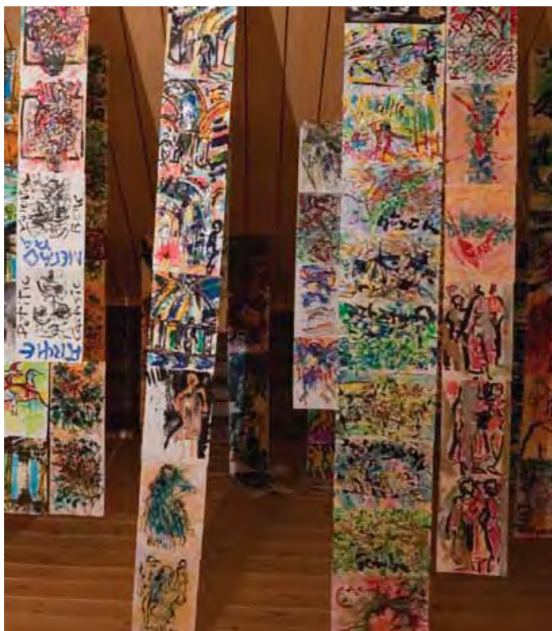
Eero kuvaa näyttelyään; "Tässä on kolme teemaa: Ihminen ja ihmissuhteet, ihmisten tekemiset, siis tavarat, ja kolmantena luonto."