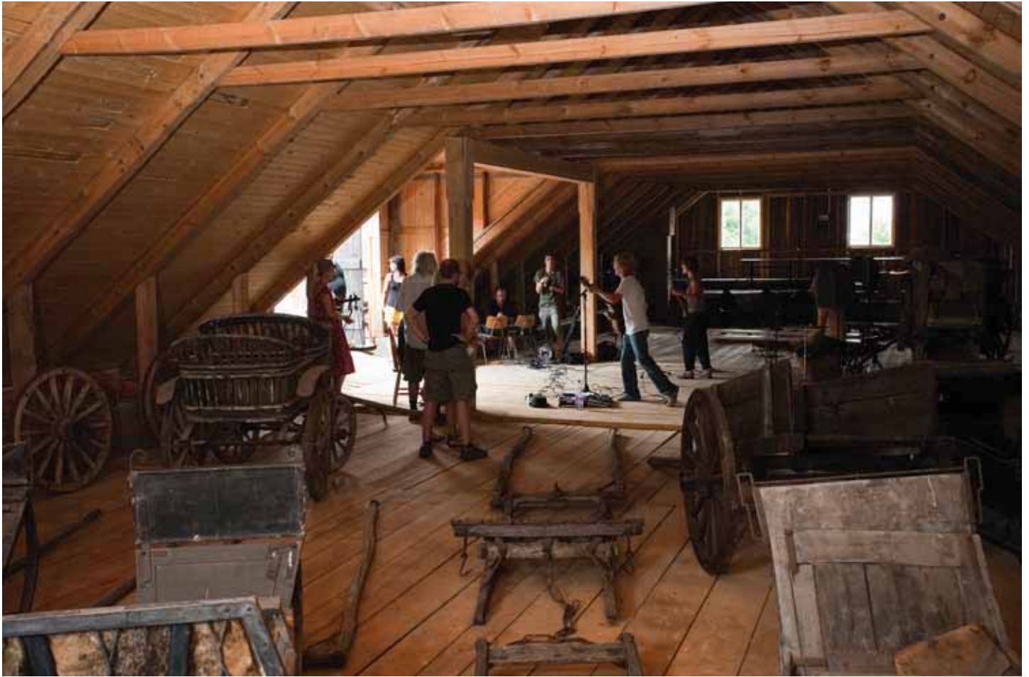
Kun avajaisten hyvä bändi, The B and The Band esiintyi, ympärille kertyi faneja jotka ottivat ahkerasti valokuvia. Etualalla on kokoelma Ylikartanon historiallisista menopeleistä. – Hevosvoimia oli tuolloin yksi ja joskus ehkä kaksi.