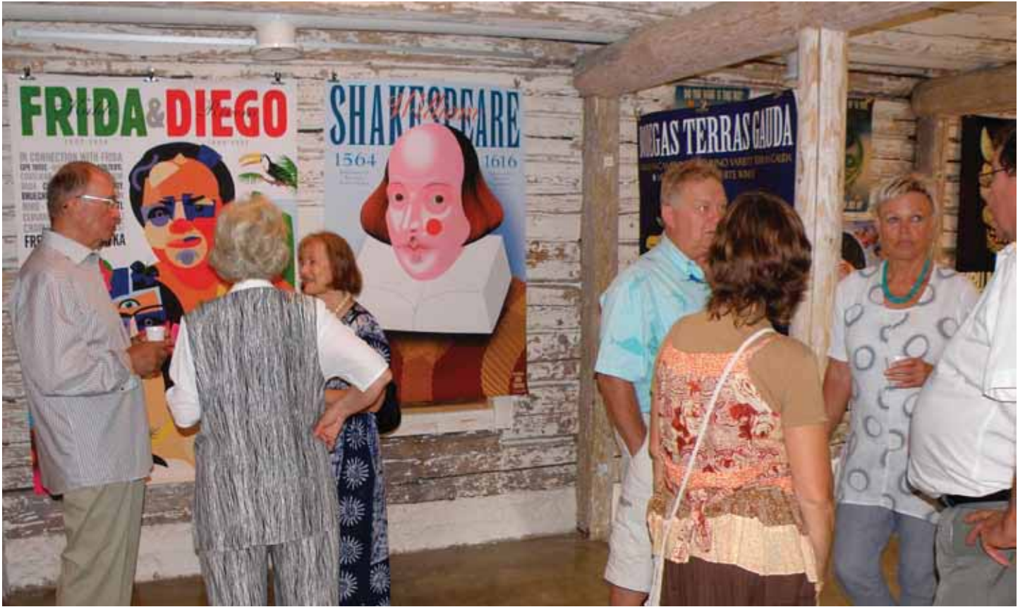
Avajaisvieraat löysivät helposti sopivia keskusteluryhmiä joissa saattoi vaihtaa ajatuksia näyttelyistä ja kaikista muistakin asioista.