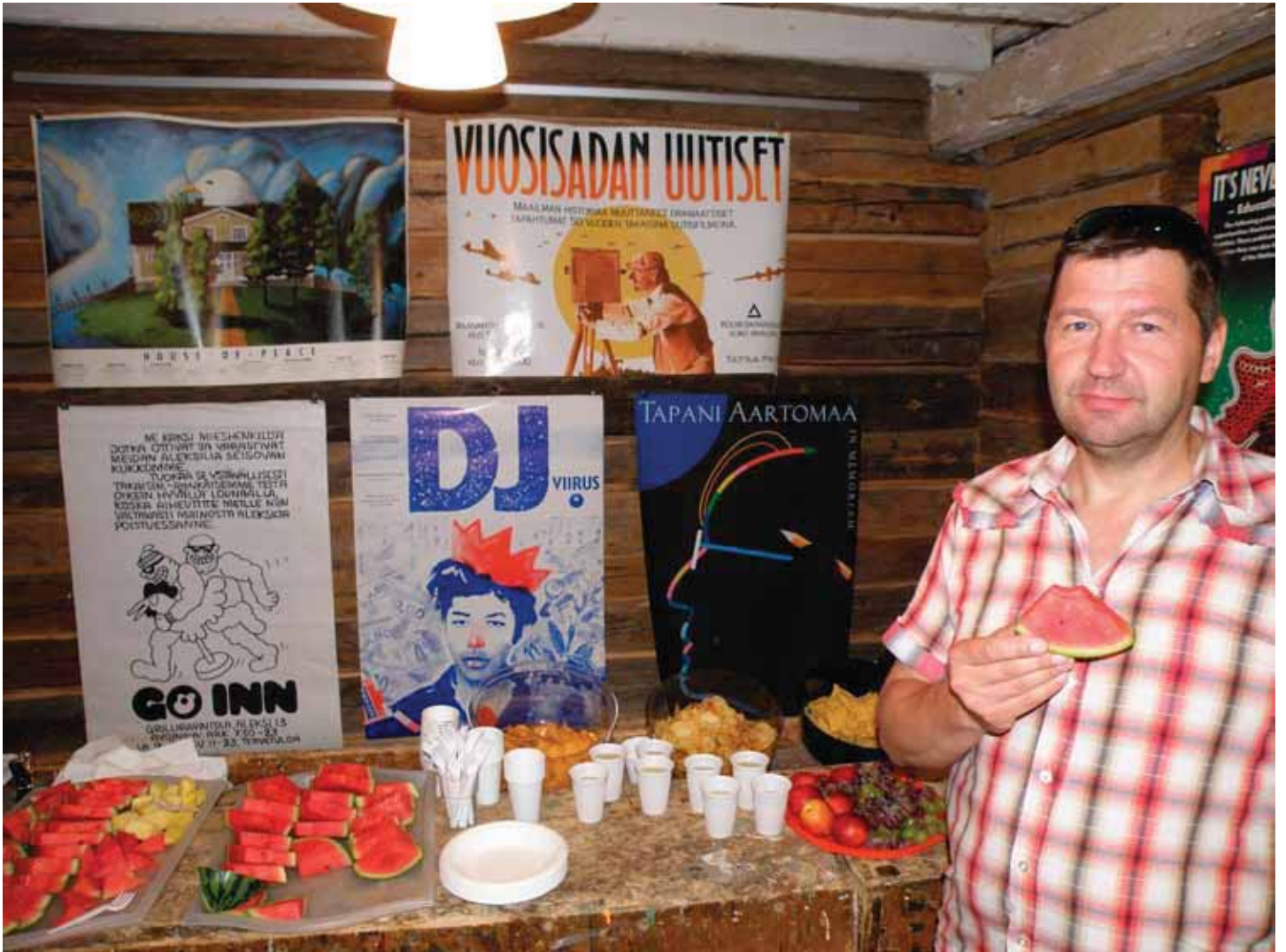
Vanha ansiokkaasti palvellut höyläpenkki toimii tässä hienosti avajaisten tarjoilupöytänä. – Samaa mieltä on Torstikin.