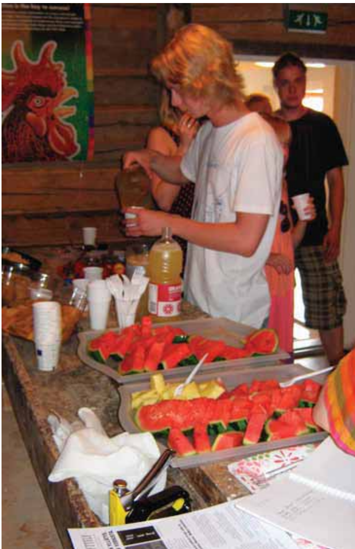
Kuumana kesäpäivänä tarjottiin kutsuvieraille sopivan kevyttä syötävää ja juotavaa.