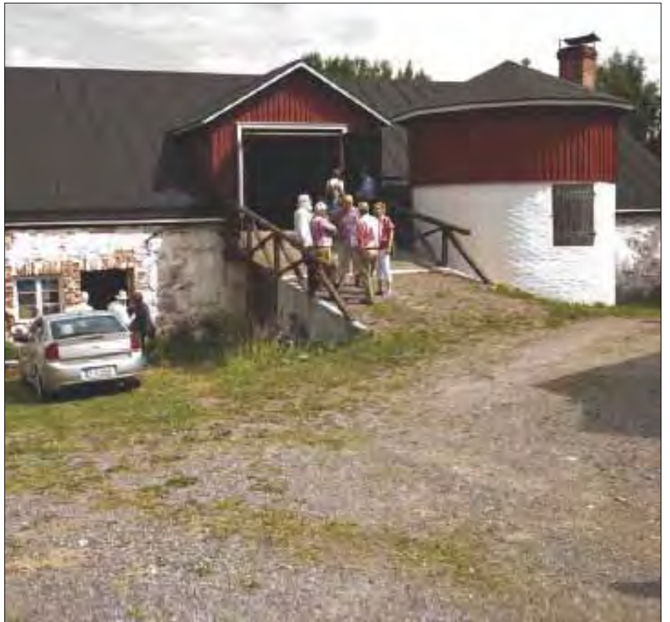
Kuvan keskellä olevan keskusteluryhmän jäsenet ovat vanhoja tuttuja keskenään Helsingistä, Mäkelänrinteen Yhteiskoulun ajoilta.